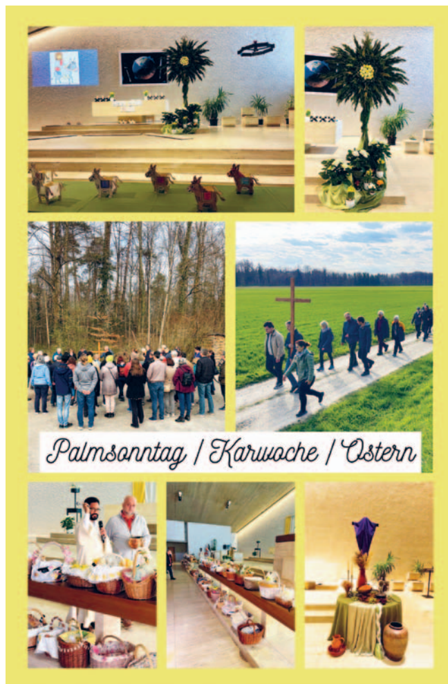
Palmsontag / Karwoche / Ostern