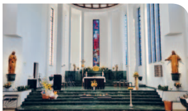
Alles bereit für die Osternacht