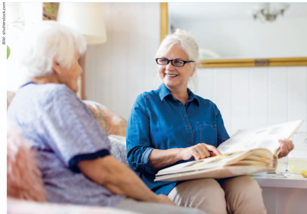
Beim Betrachten des Fotoalbums mit der Demenzkameradin werden Erinnerungen hervorgerufen.

Das Krankheitsbild löse viele Ängste aus und werde als Tabu betrachtet. Sobald ein Verdacht auf Demenz bestehe, würden sich viele dagegen sträuben, eine Untersuchung zu machen. Damit würden sie sich die Chance vergeben, von Beginn an aufgefangen zu werden. Oder sie würden in einer