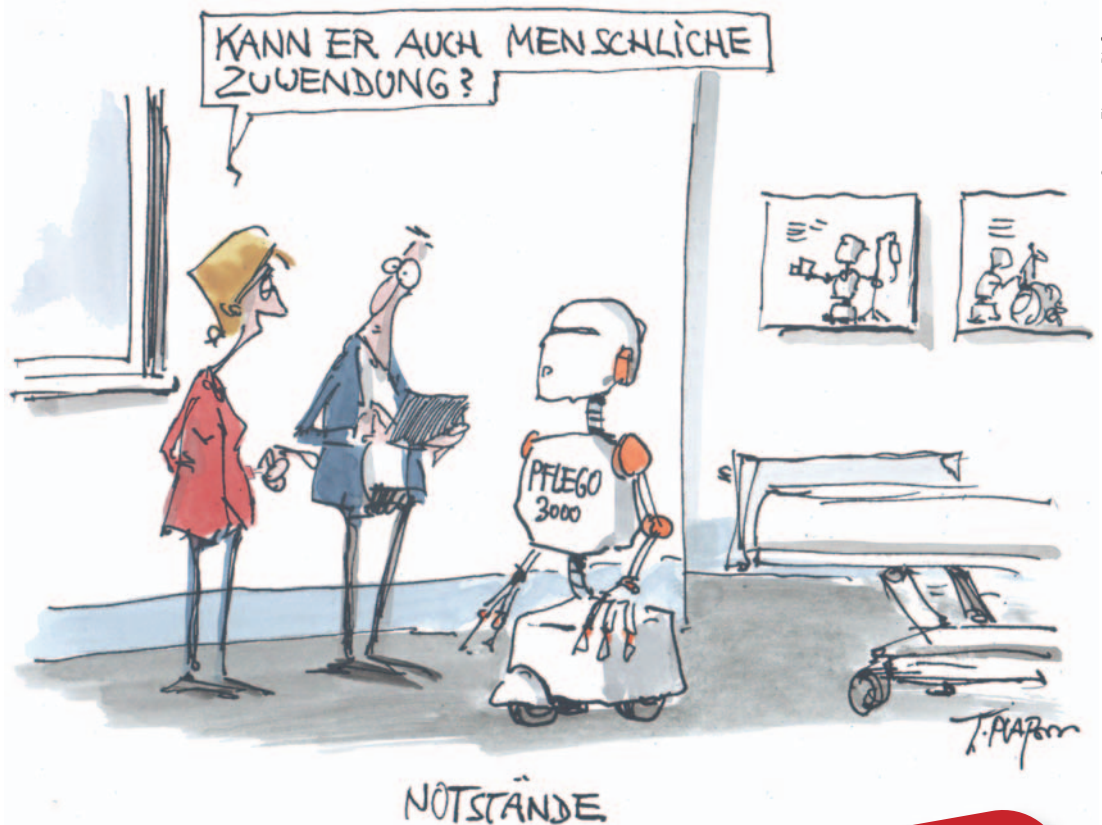
Cartoon: Thomas Pfaffmann