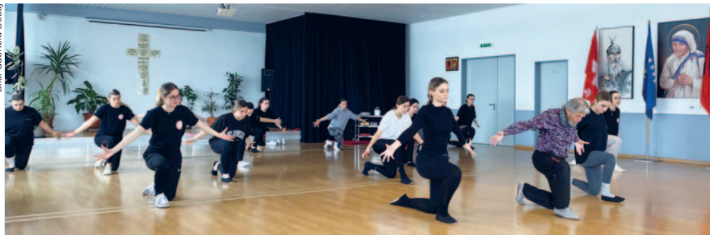
Ansambli Arbëresha probt aktuell für das 20-Jahre-Jubiläum.