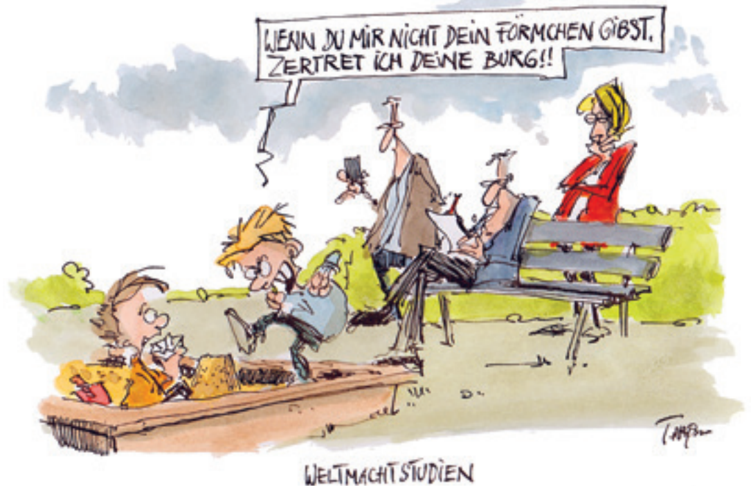
Cartoon: Thomas Pfäffmann