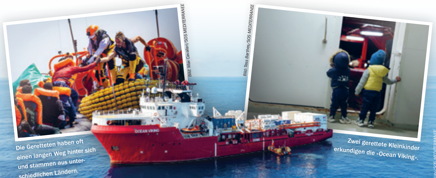
Die Geretteten haben oft einen langen Weg hinter sich und stammen aus unterschiedlichen Ländern.