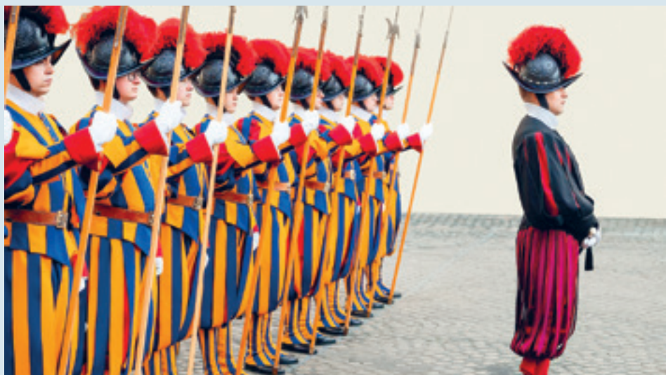
Schweizergardisten stellen sich 2021 für einen Staatsempfang auf.

Die Schweizergarde ist die älteste noch aktive militärische Einheit der Welt. Sie besteht ausschliesslich aus Schweizern. Ihr Wahlspruch «Acrier et fideliter» ( Tapfer und treu ) bringt ihren Auftrag und ihr Ethos zum Ausdruck.