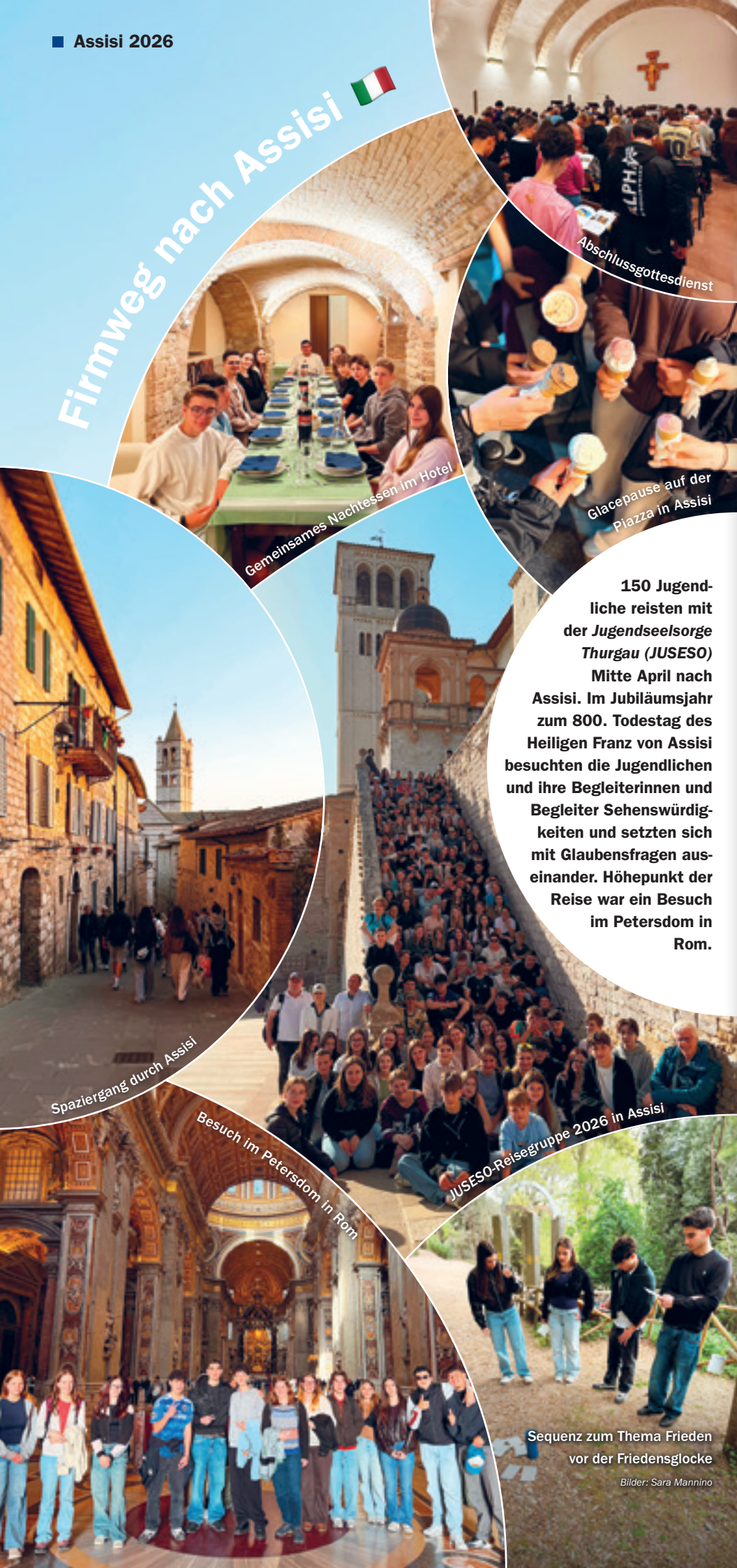
Gemeinsames Nachtessen im Hotel