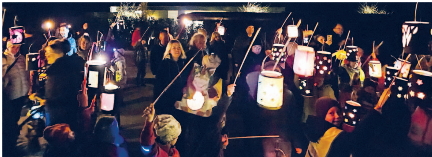
Strahlende Kinderaugen am St. Martinsumzug in Altnau.

Wenn Sie in Illighausen einen Besuch wünschen, bitte bei Ch. Berges, 079 211 45 31 melden. Danke