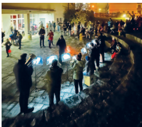
Blick in die Arena