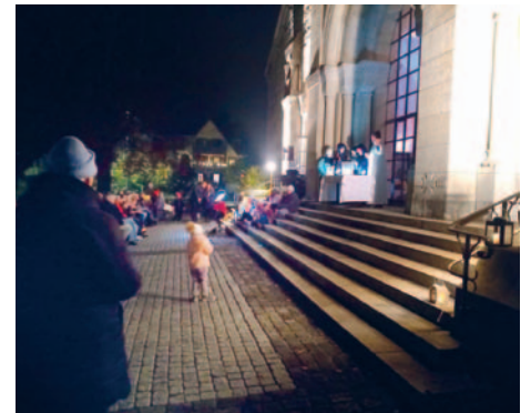
Die St. Martinsfeier mit Dä pipsändä Chilämüs und Laternenumzug vom 8. November war ein schöner Anlass mit vielen Mitfeiernden.