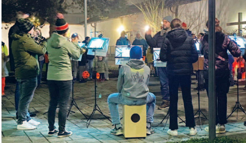
Harmonie Juniors im Einsatz