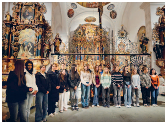
Die Firmanden wurden im Gottesdienst vorgestellt.