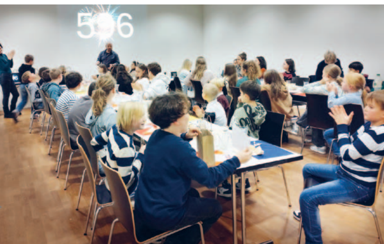
Nach dem Gottesdienst in Münsterlingen wurden die Ministranten beim Jahresabschluss gewürdigt.