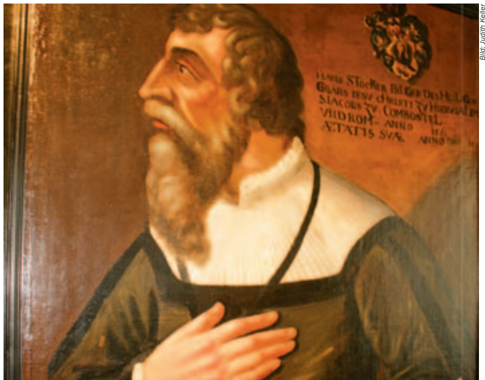
Bildnis des Chronisten Hans Stockar (Öl auf Leinwand, Museum zu Allerheiligen)