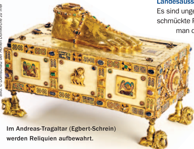
Im Andreas-Tragaltar (Egbert-Schrein) werden Reliquien aufbewahrt.