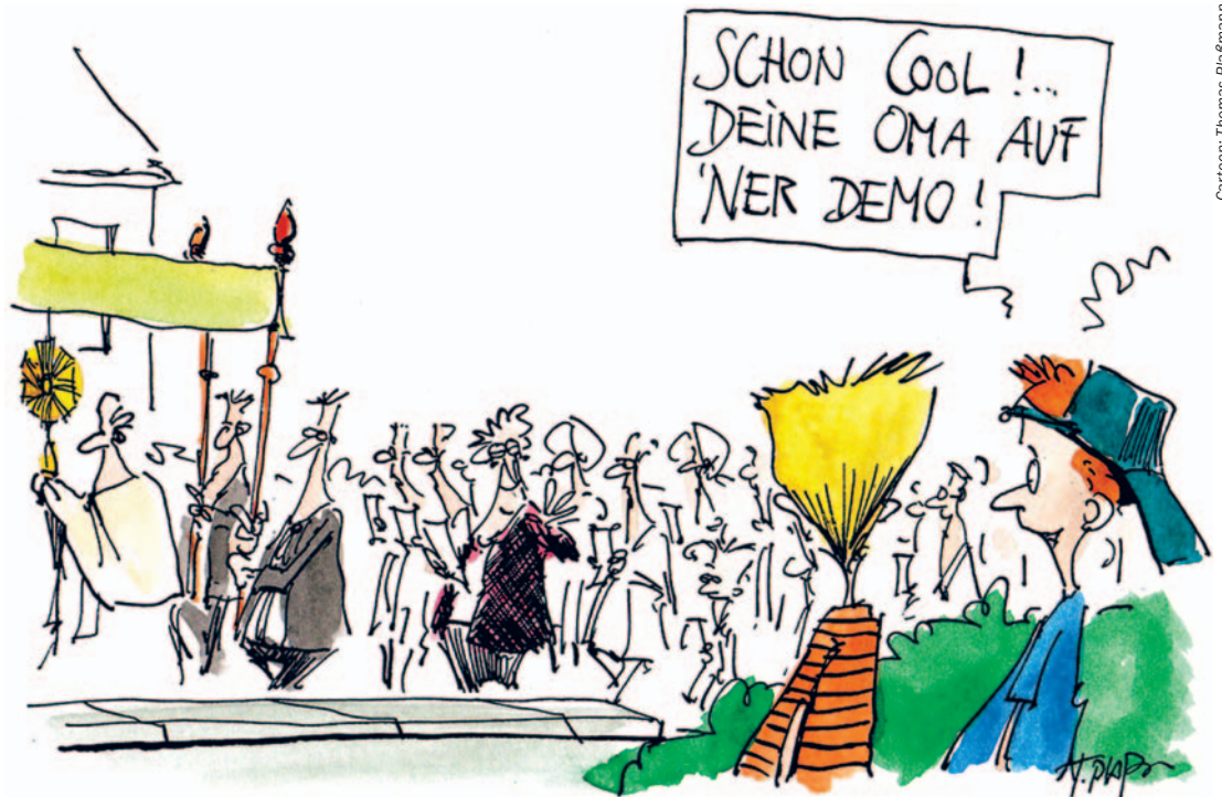
Cartoon: Thomas Pfaffmann