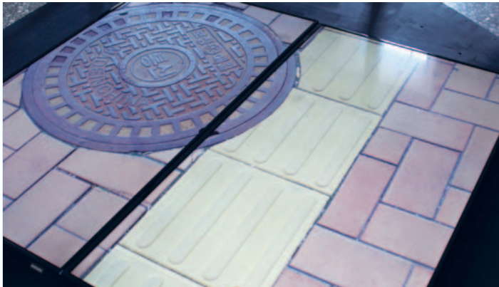
Foto des Bodens vom 16. Juni 2022 um 15 Uhr