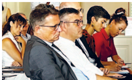
Bischof Gmür verfolgt die Pressekonferenz zur Missbrauchsstudie der UZH.

In einem späteren Interview wird dieser fragwürdige Umgang mit den Dokumenten als weiterer Verfahrensfehler deklariert. Als Bischof Felix Gmür anlässlich der Vorstellung des Berichtes zum Pilotprojekt der Universität Zürich (UZH) direkt auf einen möglichen Rücktritt angesprochen wird, antwortet er: «Weglaufen ist keine Lösung.»